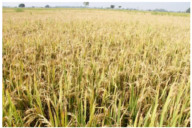
सरकारले खरिद गर्ने नसकेकाले विचौलियाहरूकै भर पनुपरेको

दैनिक समाचारदाता राजविराज, १६ मंसिर। प्रदेश २ र संघीय सरकारको समन्वयमा धानको न्यूनतम खरिद मुल्य निर्धारण गरिएपनि हालसम्म सो मुल्य कार्यान्वयन नहुँदा किसानहरू चिन्तित देखिएका छन्। असोजको दोस्रो साता सरकारले प्रति क्विन्टल मोटो धान २ हजार ७ सय ३५ रुपैयाँ र, मध्यम २ हजार ८ सय ८५ रुपैयाँ निर्धारण गरेको थियो। धानवाली लगाउने समयमा सरकारले धानको समर्थन मुल्य तोके पनि अहिले धान भित्रियाउँदा